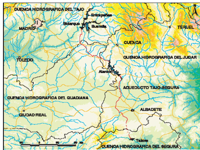
Plano general del Acueducto Tajo-Segura